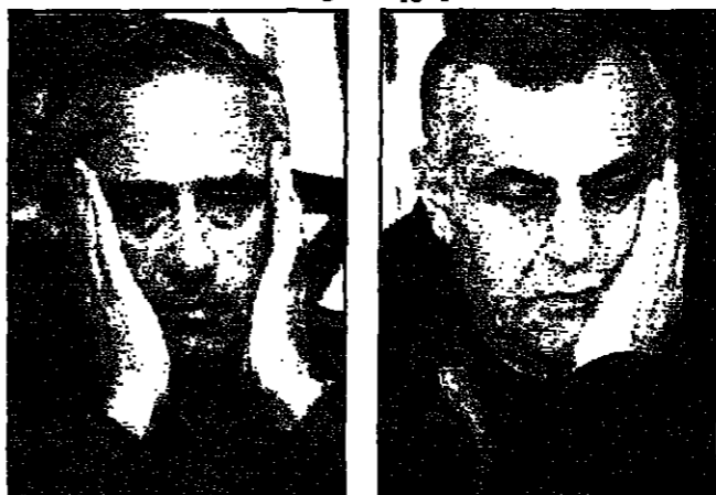
موروخاي وشاحاك لدى تفقيها خبر الكارثة

القسم - القدس - الفلسطينيون العرب - الف: اب - استعدت اسرائيل امس الاربعاء ليوم حد ومراسم تشييع غالية المستوى لـ 73 الجندي لقوا مصرعهم في حادث اسلحة بين مروحيات فوق لحدى مناطق شمال البلاد. وقد تم التعرف على هوية القتلى والى اهلهم، وادعت الحكومة والبرلمان والفرع العام للجيش الاسرائيلي ستعد جاسات حد خاصة. وقد تم التعرف على هوية القتلى والى اهلهم، وادعت الحكومة والبرلمان والفرع العام للجيش الاسرائيلي ستعد جاسات حد خاصة. وقد تم التعرف على هوية القتلى والى اهلهم، وادعت الحكومة والبرلمان والفرع العام للجيش الاسرائيلي ستعد جاسات حد خاصة. وقد تم التعرف على هوية القتلى والى اهلهم، وادعت الحكومة والبرلمان والفرع العام للجيش الاسرائيلي ستعد جاسات حد خاصة.